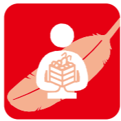
高齢者への 配食サービス