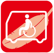
福祉車両の整備や 機器整備