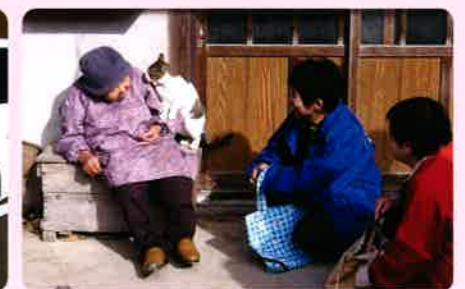
高齢者を地域で見守ります。