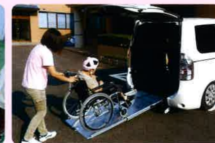
障がい者をサポートします。