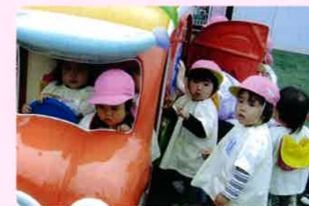
子どもの施設を整備します。